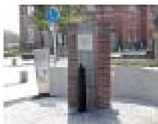
福岡県庁 記念水栓