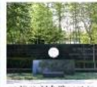
エジソン記念碑(八幡市)