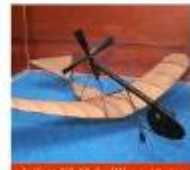
カラス見飛行器(八幡市)