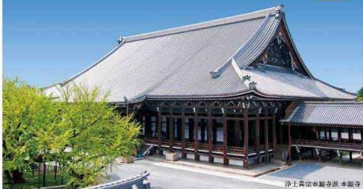
浄土真宗本願寺派 本願寺