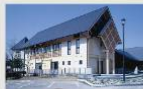
杉原千畝記念館 The Chiune Sugihara Memorial Hall

千畝の生まれ育った、自然豊かなこの地に建つ記念館では、勇気ある決断と人間愛に触れることができます。