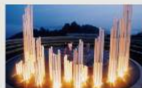
人道の丘公園 The Hill of Humanity

千畝の生まれ育った、自然豊かなこの地に建つ記念館では、勇気ある決断と人間愛に触れることができます。