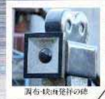
調布-秋田発祥の礎