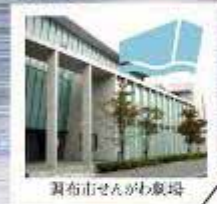
調布市せんがわ劇場