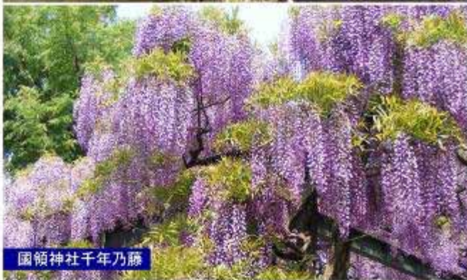
國領神社千年乃藤