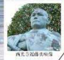
西光寺近藤勇座像