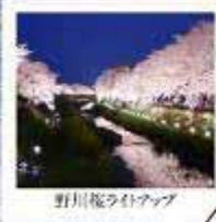
野川桜ライオンアップ