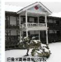
旧豊平宮尋常小学校