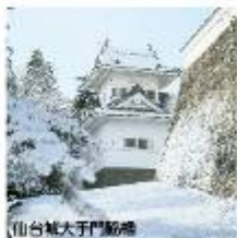
仙台城大手門跡地