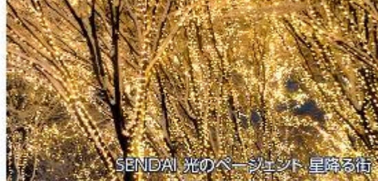
SENDAI 光のページェント 星降る街