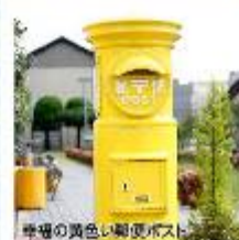
平場の黄色い郵便ポスト