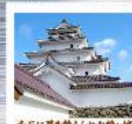
赤瓦に葺き替えられた鶴ヶ城