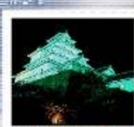
ライトアップされた鶴ヶ城