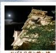
おぼろ月夜と鶴ヶ城