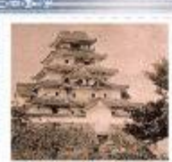
明治初期の鶴ヶ城