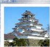
赤瓦に葺き替えられた鶴ヶ城