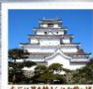
赤瓦に葺き替えられた鶴ヶ城