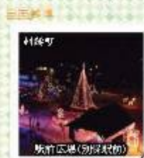
旅館区画(別荘区画)