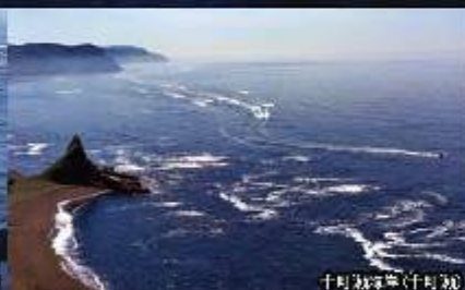
十町瀬海軍(十町瀬)