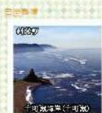
十町瀬海軍(十町瀬)