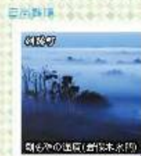
鳴る水の環礁(岩保木水門)