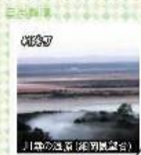
川津の漁船(涌雲泊)