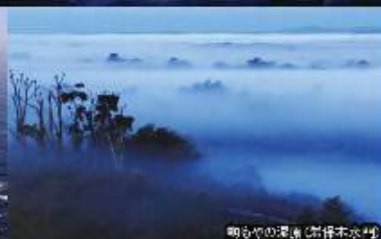
鳴る水の環礁(岩保木水門)