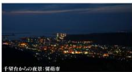
千望台からの夜景:留萌市