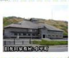
旧花田家倉庫:小平町