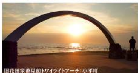
旧花田家倉庫前トワイライトアーチ:小平町