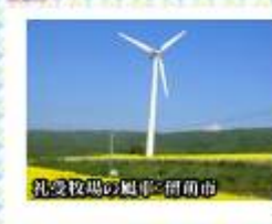
礼受牧場の風車:留萌市