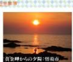
黄金岬からの夕陽:留萌市