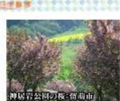
神尾岩公園の夜:留萌市