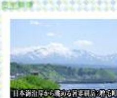
日本海沿岸から眺める留萌岳:増毛町