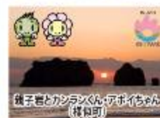
鏡子岩とカシラシくん・アボイちゃん(模似町)