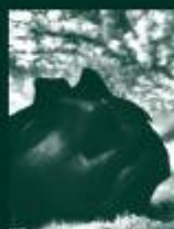
洞爺湖有珠山ジオパーク