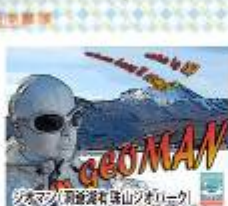
ジオマン(洞爺湖有珠山ジオパーク)