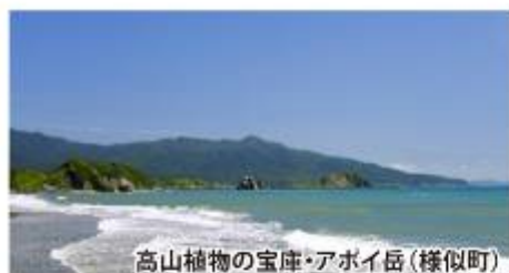
高山植物の宝庫・アボイ岳(模似町)