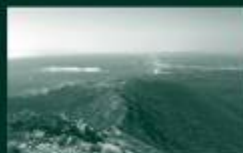
アボイ島ジオパーク