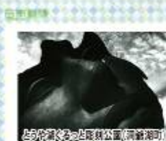
とらや洞窟ととらや公園(洞爺湖町)