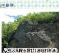
八景沢黒曜石露頭(遠軽町白滝)