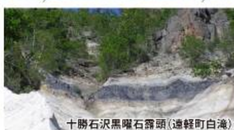
十勝石沢黒曜石露頭(遠軽町白滝)