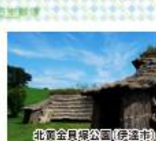
北真金貝塚公園(伊達市)