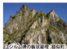
エシル山頂の板状節理(模似町)