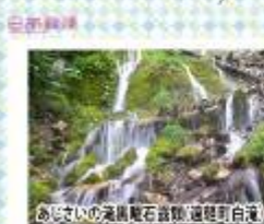
あじさいの滝黒曜石露頭(遠軽町白滝)