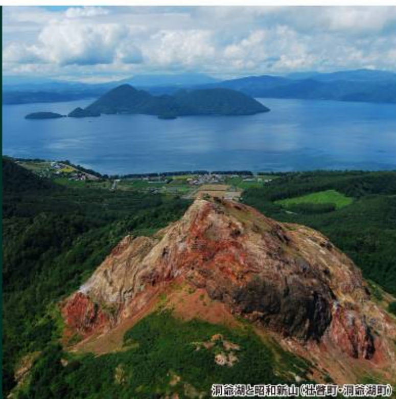
洞爺湖と昭和祈山(壮瞥町・洞爺湖町)