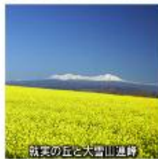
就実の丘と大雪山遍路