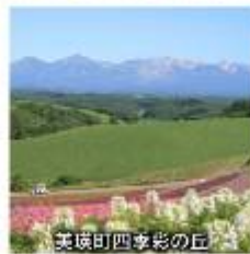
美瑛町四季彩の丘