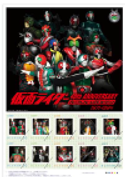
フレーム切手シート (50円切手10枚シールタイプ)×1シート