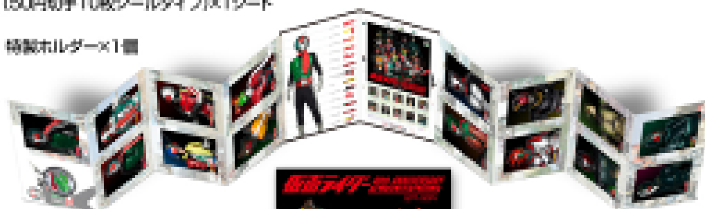
展開イメージ中面