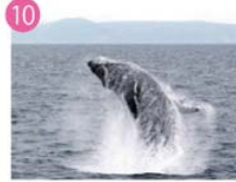
ザトウクジラ (見ることのできる時期:稀に見られる)

ネズミイルカ科の中では大きく、体長約2.3m。体は灰黒色で胸ビレの後ろから体の横にかけ白斑があり、外見はシャチに似ている。泳ぐ速さは速い部類に入り、最高55km/hほどの速度で泳ぐことが出来る。