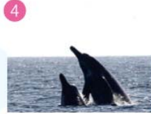
ツチクジラ (見ることのできる時期:2～3月・5～6月・8～10月)

ヒゲクジラ亜目の中では2番目に小さいミンククジラは体長約7m。古くから雑食性とされ、タラやニシンなどの魚やオキアミなどを捕食する。