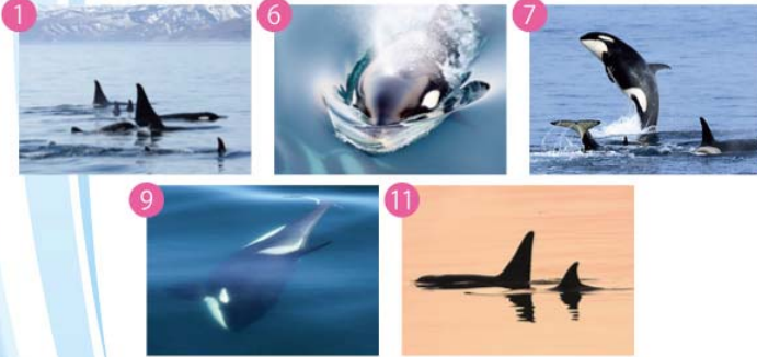
シャチ (見ることのできる時期:1月・3～7月)

体長は約7mほどで目の後方にある白い楕円斑が特徴。仲間と協力して餌を捕ったり、餌を分け合うなど社会性が強く、また、プリーチング(ジャンプ)やスパイホッピング(海面から顔を出し偵察する行動)など動きが活発で哺乳類の中で水中を最も速く泳ぐ事が出来る生物のひとつである。