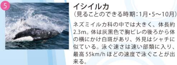
イシイルカ (見ることのできる時期:1月・5～10月)

体長は約11mとアカボウクジラ科の中では最も大きく、比較的長い口吻を持っている。生態については十分わかっていない部分が多い。