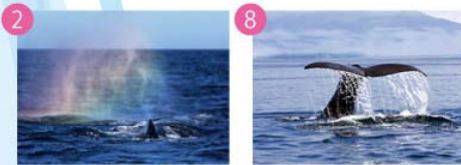
マッコウクジラ (見ることのできる時期:6～10月)

歯を持つ種類のハクジラの中で、雄は約18mにもなる大きな体を持っている。噴気孔は頭部の先端左側に位置するためブロー(潮吹き)は左前方斜めに上がる。クジラの中でも最も深く長く潜ることが出来る生物のひとつである。