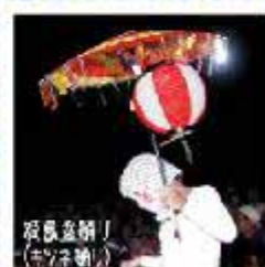
夜風堂前！ (ケハス御間)