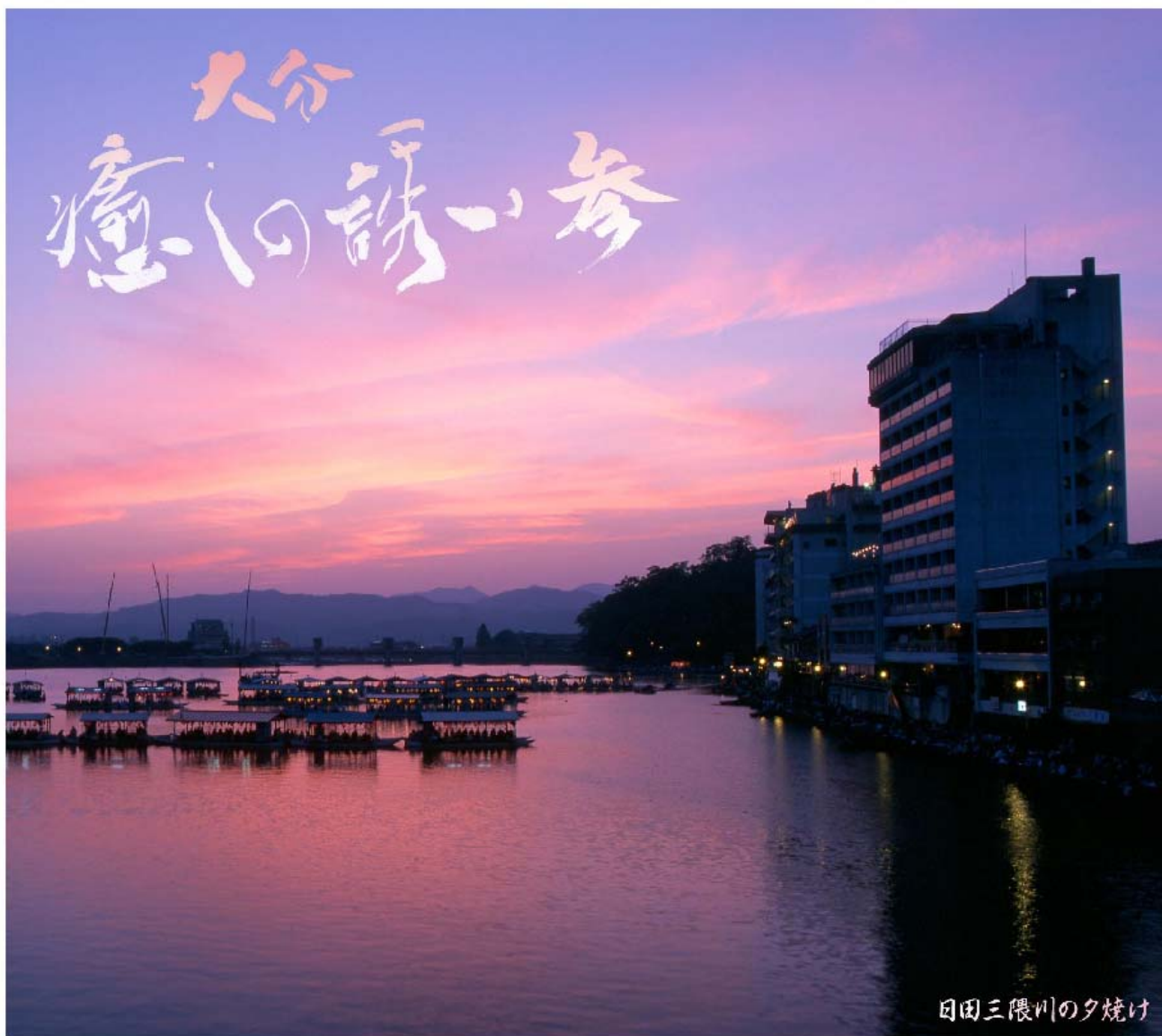
日田三隈川の夕焼け