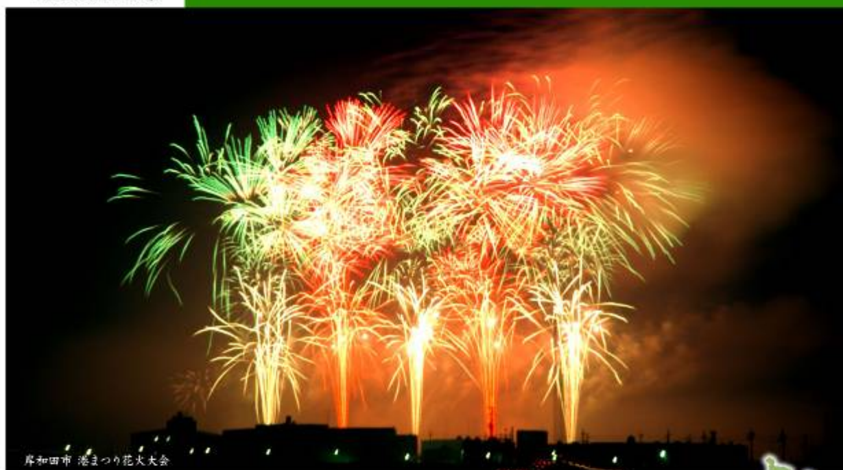
岸和田市 港まつり花火大会