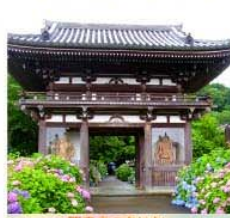
観音寺のあじさい