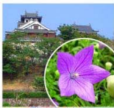
福知山城のさききょう