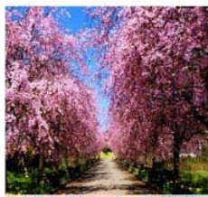
京都府・緑化センターのしだれ桜