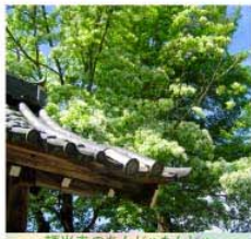
頼光寺のなんじゃもんじゃ