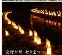
交野が原 セタまつり