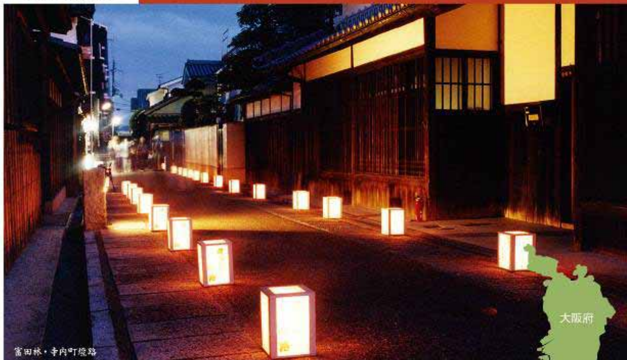
富田林・寺内町燈路