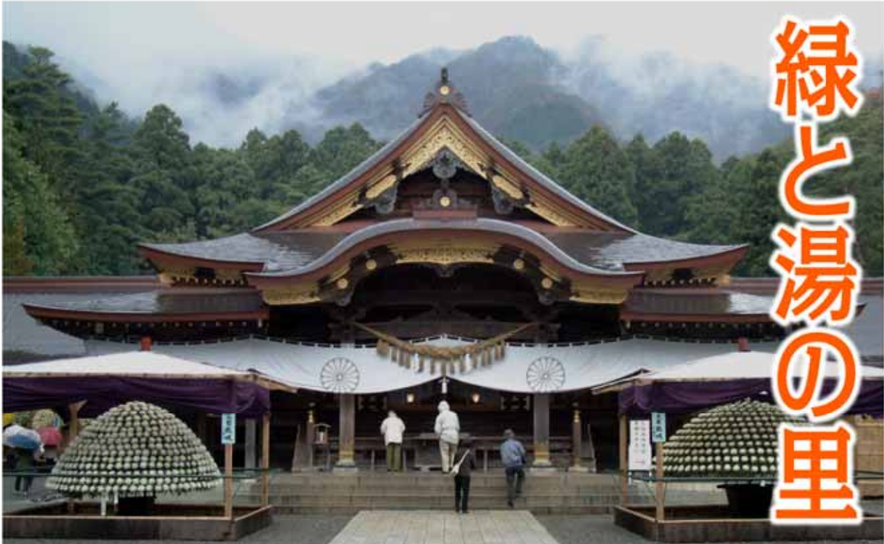
越後一宮彌彦神社