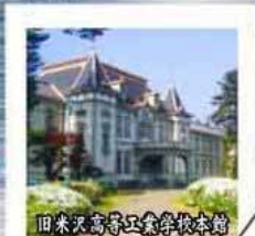
旧米沢高等学校本館