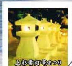
上杉雷灯籠まつり