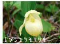
レブンアリモリソウ