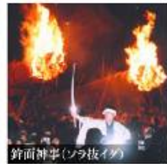
鉦面神事(ソラ板イ)