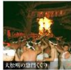
大松明の盗門くぐり