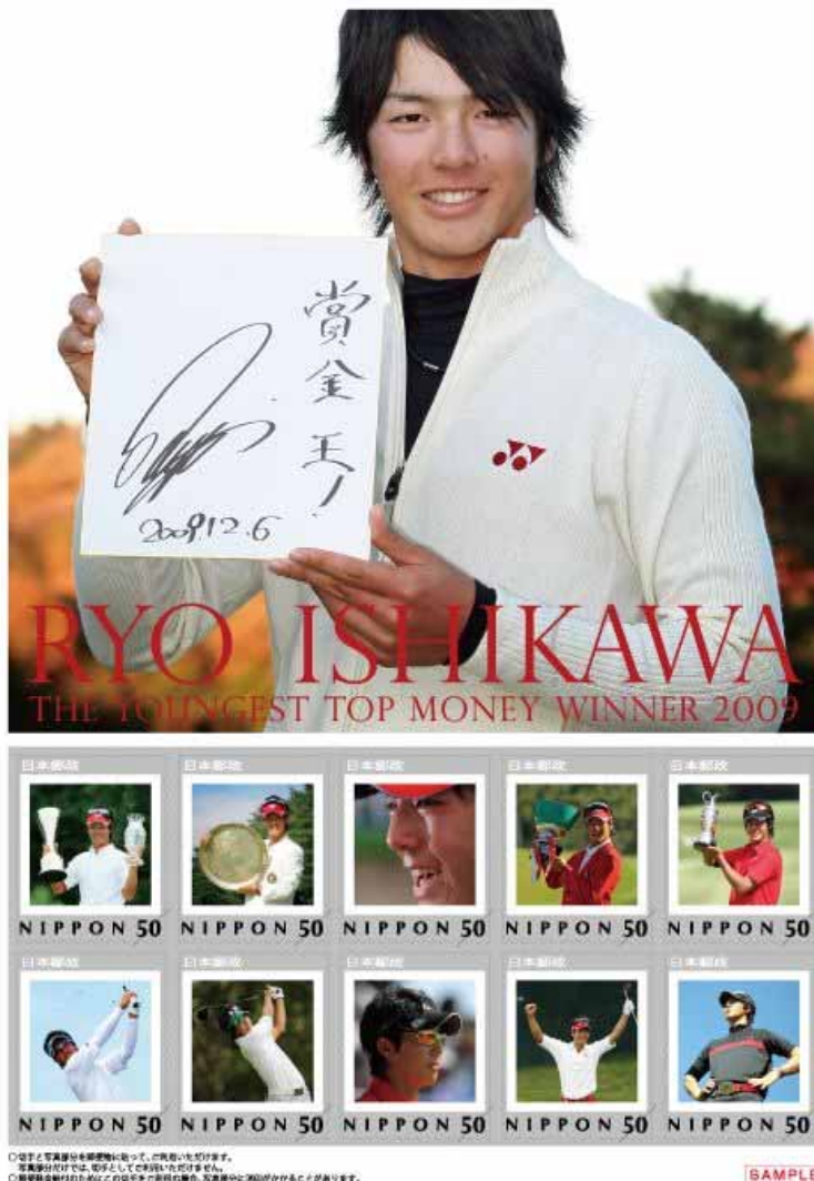
フレーム切手 イメージ