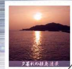
夕暮れの祖島遠景