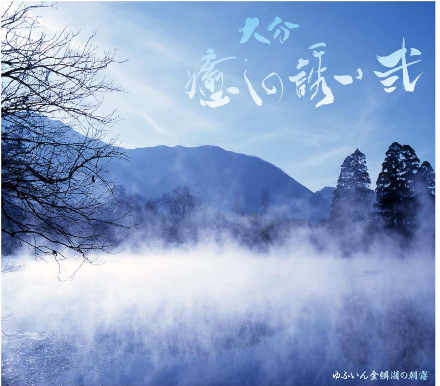
ゆふいん金鱗湖の朝霧