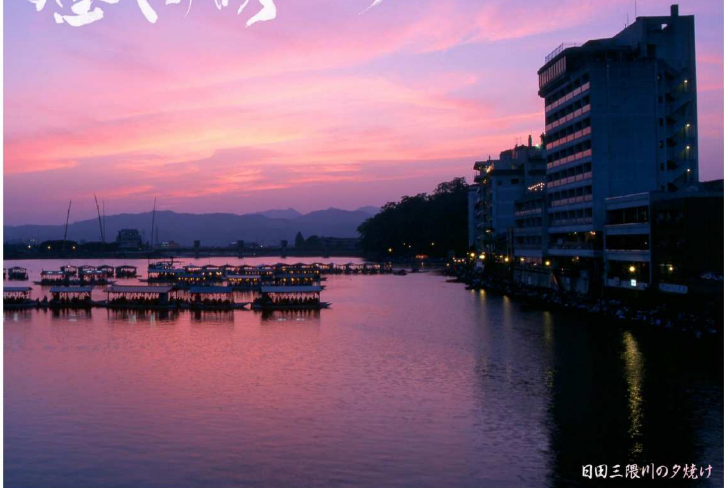
日田三隈川の夕焼け