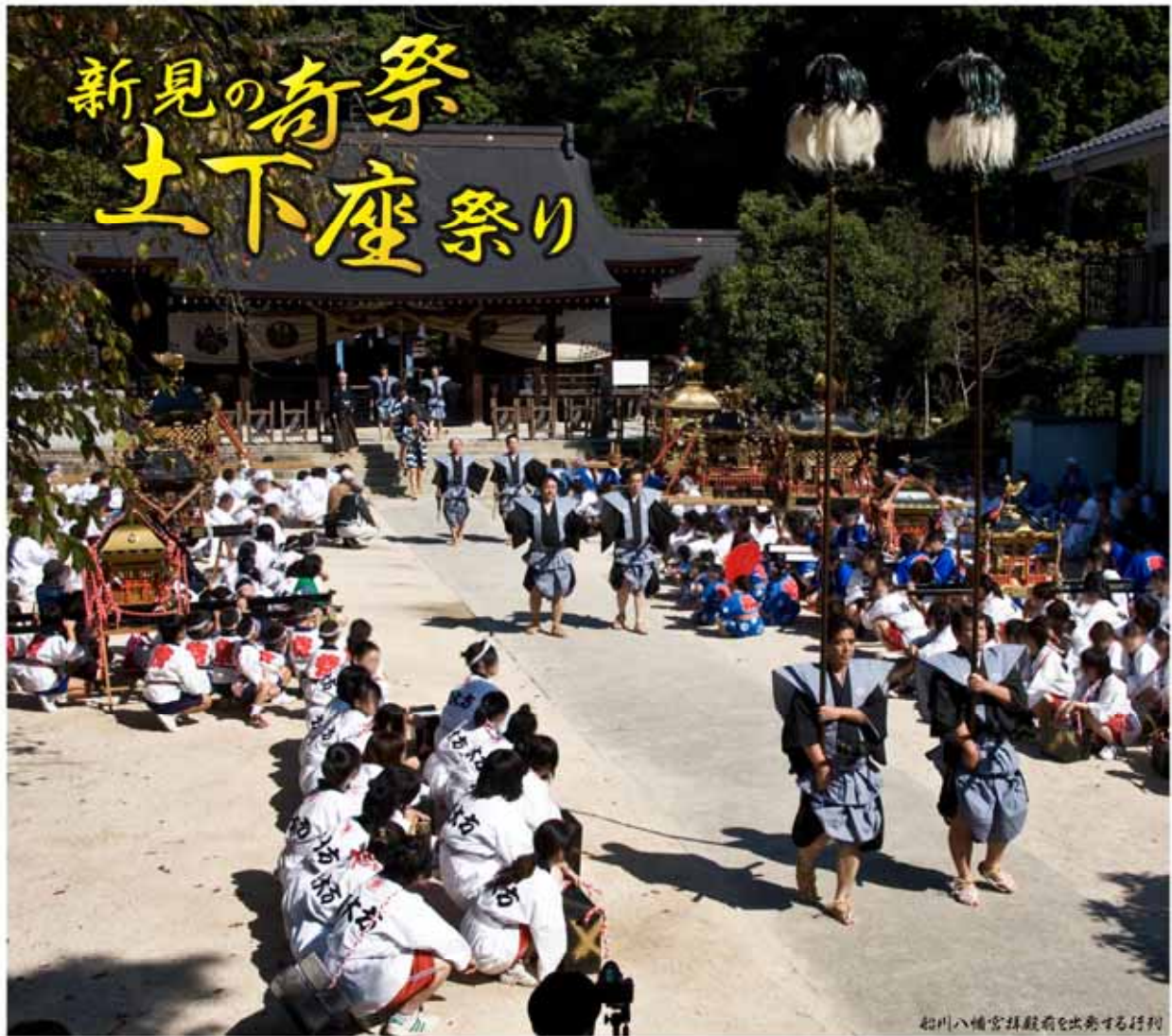
北川八幡宮拝殿前を出発する行列