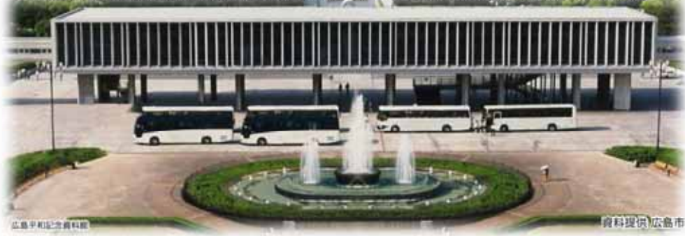
広島平和記念資料館

被爆後、廃墟と化した広島市の復興は、人口の急減や建物の壊滅などともなう税収の激減により、遅々として進みませんでした。このため、国に対し、国有地の無償譲渡などを要望しましたが、多くの戦災都市の中で広島市だけに特別な財政的援助を与える余地は国にはありませんでした。 そこで、考え出されたのが、憲法第95条による特別法（＝特定の地方公共団体のみに適用される法律）の制定であり、広島市、広島市議会、地元選出国會議員など多くの人の尽力によって国会に提出され、昭和24年（1949年）5月、衆参両院において満場一致で可決されました。 特別法の制定のためには住民投票で過半数の同意が必要であるため、同年7月7日にわが国で初めての住民投票が行われ、圧倒的多数の賛成を得て、平和記念日である8月6日に公布・施行されました。この法律により、広島市を世界平和のシンボルとして建設することが国家的事業として確立されました。このことは、一地方都市の復興が世界平和の原点として位置付けられ、歴史的に大きな意義をもつものとなりました。