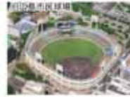
広島県立産業奨励館 広島市公文書館所蔵