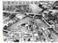
広島県立産業奨励館