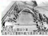
広島県庁設計案 広島市公文書館所蔵(写真提供)浦沢氏