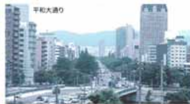
平和大通り