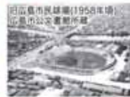
広島県立産業奨励館(1930年頃)