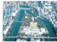
平和記念公園