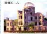
原爆ドーム