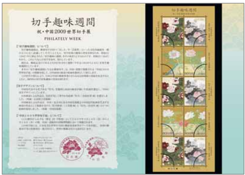
切手帳を開いた状態