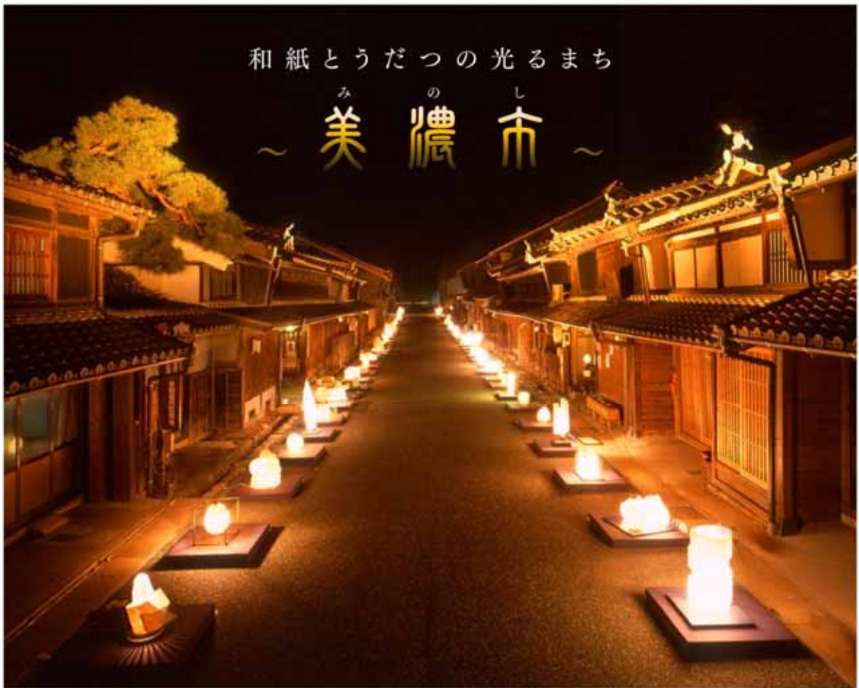
【美濃和紙あかりアート展】

岐阜県美濃市では、1300年の伝統を誇る「美濃和紙」を使ったあかりのアート作品を全国から募集し、重要伝統的建造物群保存地区に選定されている「うだつの上がる町並み」全体を会場として展示し、コンテストをします。