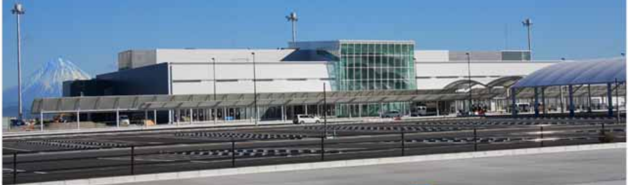
富士山静岡空港ターミナルビル