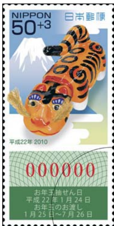
(3) 平成 22 年用寄附金付お年玉付年賀 50 円郵便切手