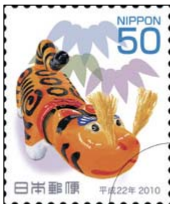
(1) 平成 22 年用年賀 50 円郵便切手