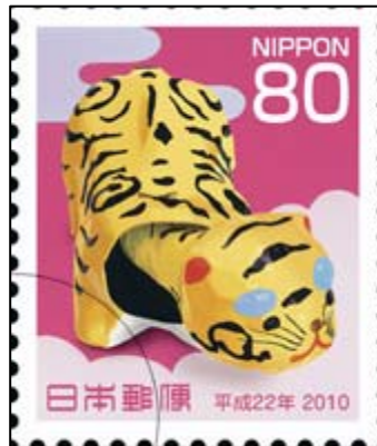
(2) 平成 22 年用年賀 80 円郵便切手