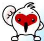
トッキッキ (ペアで)