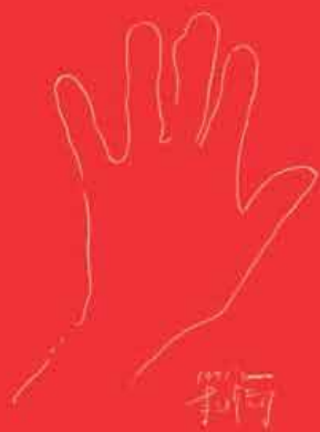
寺山修司記念館 (青森県三沢市)