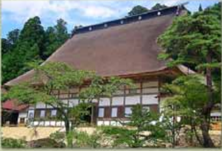
本堂(法堂) 国指定重要文化財

日本一の大きさの茅葺屋根。間口29.6m、奥行21m、高さ26mの大きさ、1811年伊達家により再建された。