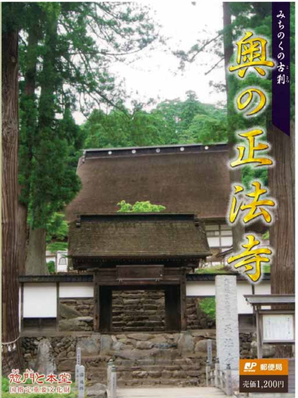
梵門と本堂 国指定重要文化財