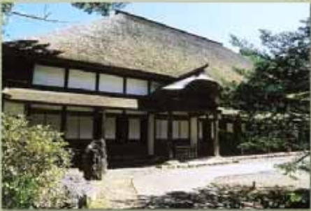
庫裡 国指定重要文化財