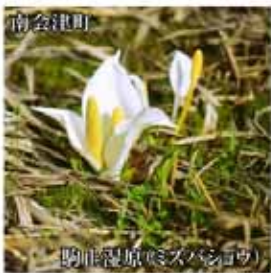
駒形湿原(みずはしり)