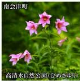
高清水自然公園(ひめさゆり)