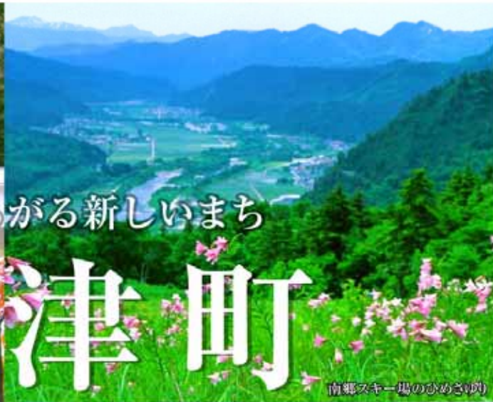
南郷スキー場のひめさゆり