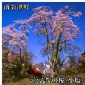
寺えんでの桜(小塩)