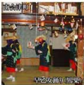
早乙女踊り(早乙女)