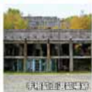
手稲区立総合庁舎