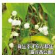
自生すずらん群生 (富田西公園)