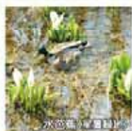
水芭蕉(前田森林公園)