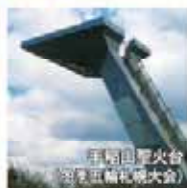
手稲区立火台 (区立五輪札幌大会)