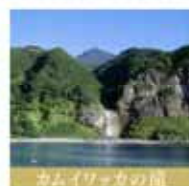
カムイワッカの湾