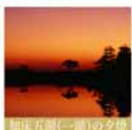
知床五湖(一湖)の夕焼