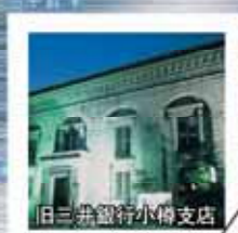
旧三井銀行小樽支店