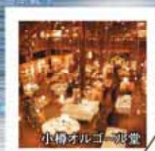
小樽オルゴール堂