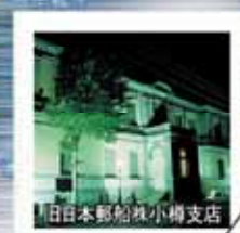
旧日本郵船社小樽支店