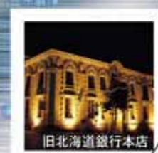
旧北海道銀行本店