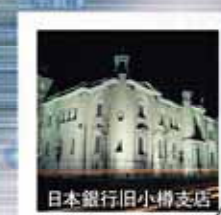
日本銀行旧小樽支店