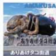
ありあけタコ街道