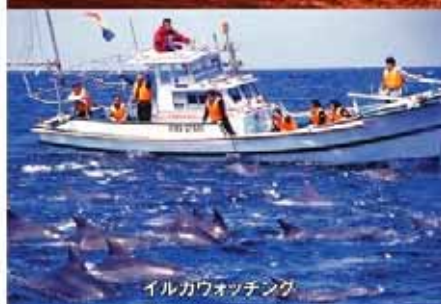
イルカウォッチング