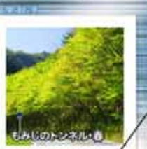
もみじのトンネル・春