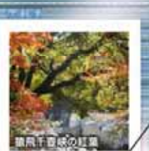
猿飛千香峡の紅葉