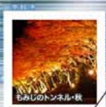
もみじのトンネル・秋