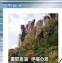
裏耶馬溪 伊福の景