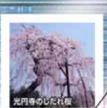
光円寺のしだれ桜