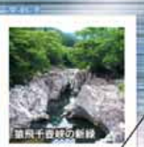
猿飛千香峡の新緑