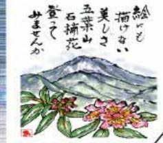
釜石の五葉山 石楠花 登つて おまへんか