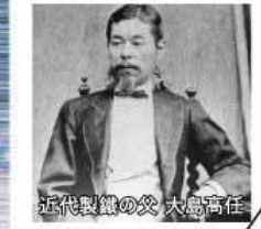
近代製鉄の父 大島高任