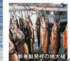
新巻鮭発祥の地大槌