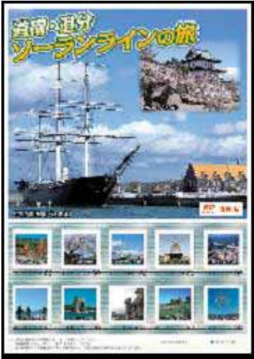
「道南・道分ソーランラインの旅」