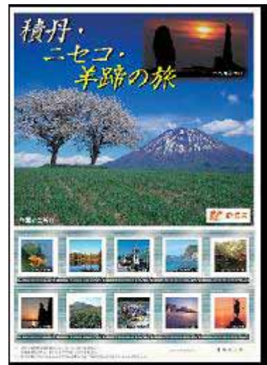
「積丹・ニセコ・羊蹄の旅」