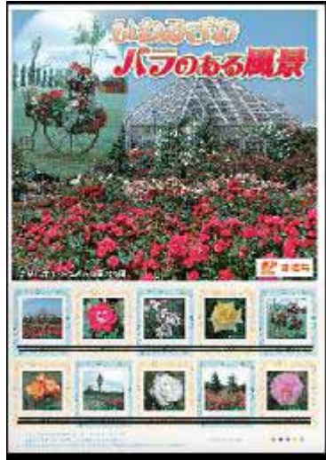
「いわみざわバラのある風景」