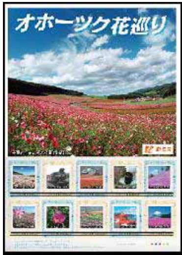
「オホーツク花巡り」