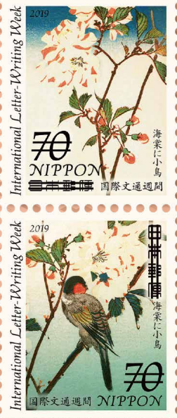
International Letter-Writing Week. 2019 国際文通週間