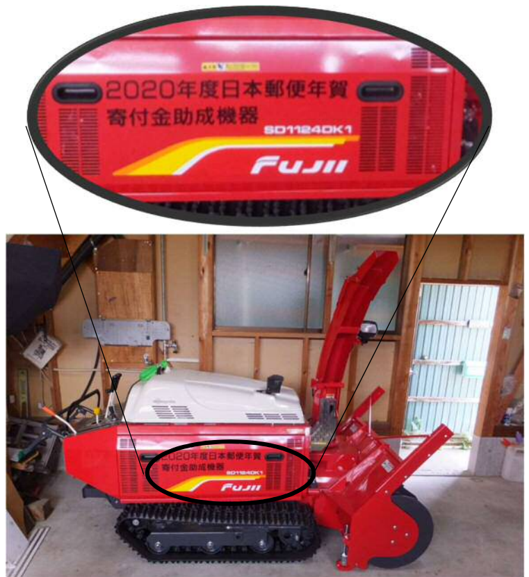
【機器購入（本体への表示）】