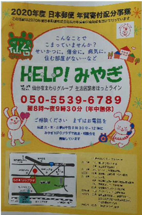
【活動関係（チラシに表示）】