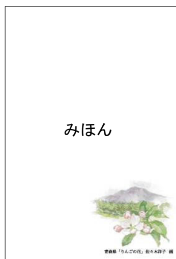
【絵入り（地方版・青森県）】