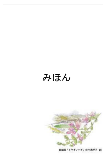
【絵入り（地方版・宮城県）】