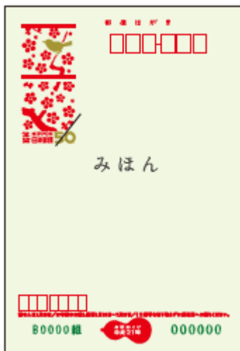
【いろどり年賀 うぐいす】