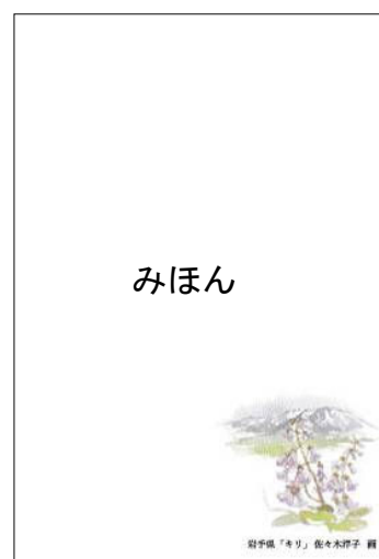
【絵入り（地方版・岩手県）】