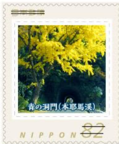
青の洞門(本耶馬溪)