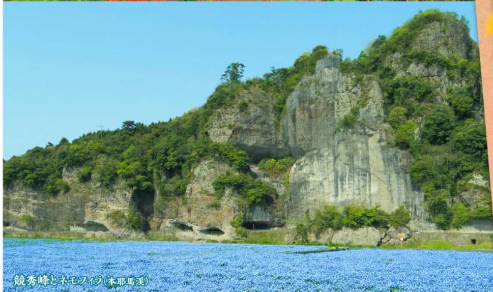
競秀峰とネモフィラ(本耶馬溪)