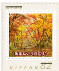
御堂もみじ(耶馬溪)