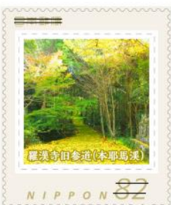
羅漢寺旧参道(本耶馬溪)