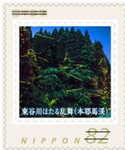
東谷川はたる乱舞(本耶馬溪)