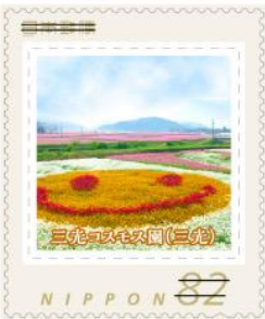
三宅のふれあいの丘(三宅)