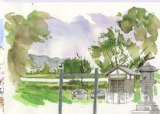
武庫川河川敷(髪の渡し)