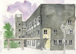
尼崎市立大庄公民館(旧大庄村役場)