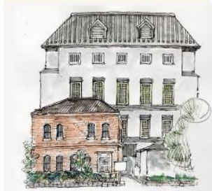
尼崎信用金庫記念館(旧尼崎信用組合本店)