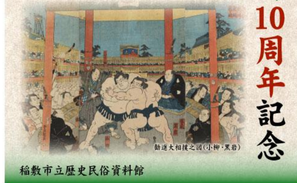
稲敷市立歴史民俗資料館