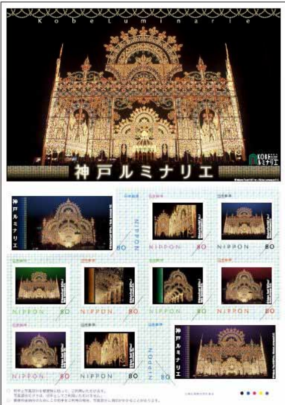
神戸ルミナリエポストカード