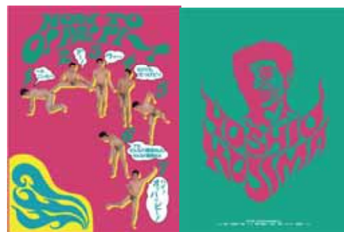
特製ホルダー内側