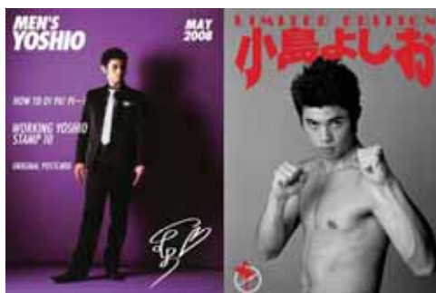
特製ホルダー外側