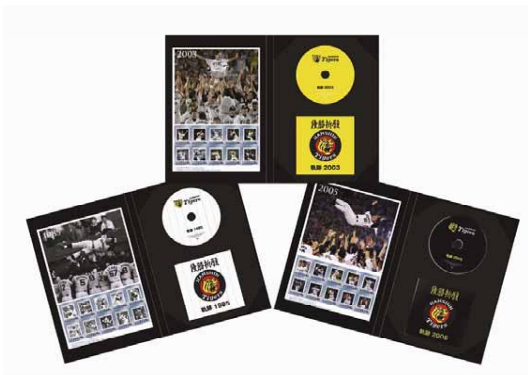
特製ホルダーセットイメージ (フレーム切手+CD+説明書)